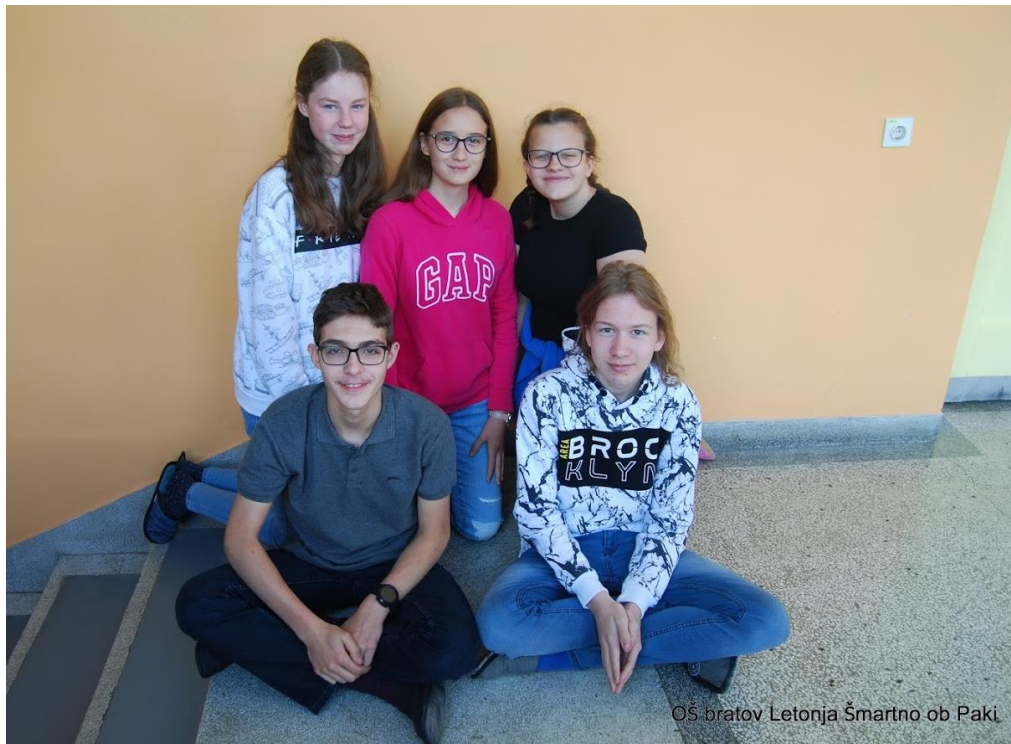
OŠ bratov Letonja Smartno ob Paki