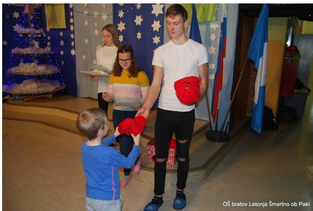
OŠ bratov Letonja Šmartno ob Paki