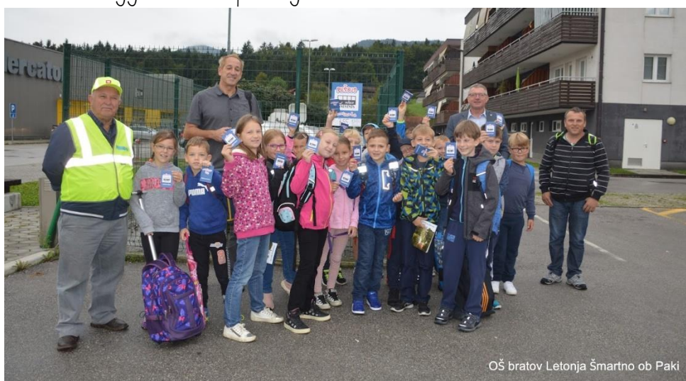
OŠ bratov Letonja Šmartno ob Paki

Dokazano je, da ima takšno spodbujanje rekreacije učencev več prednosti. Učenci, ki v šolo hodijo peš, so v povprečju vsak dan fizično aktivni več časa in so boljje telesno pripravljene kot otroci, ki se v šolo vozijo. Prav tako pešbus spodbuja osebni in socialni razvoj otrok, saj ti razvijajo neodvisnost, krepi se njihov občutek odgovornosti in zavest o lastnih zmožnostih. Otroci s premagovanjem krajših razdalj v okolju, ki ga poznajo, postopoma osvajajo prometne predpise in pravila vedenja ter postajajo suvereni udeleženci v prometu. Z zgodnjim razvijanjem zdravih navad, kot je pešačenje, vzgajajo ozaveščene posameznike z zdravim in okolju prijaznim življenjskim slogom. Zato s Pešbusom nadaljujemo tudi v prihodnjem šolskem letu.