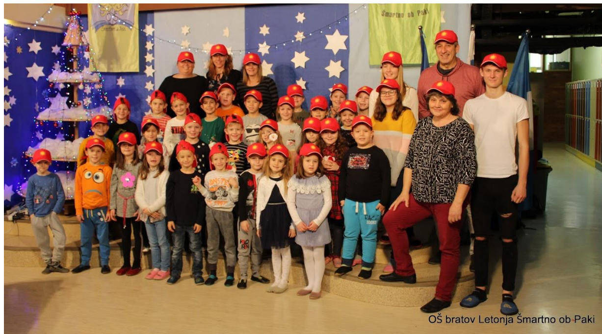
OŠ bratov Letonja Šmartno ob Paki