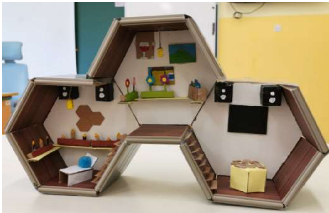
Slika 8: Maketa Ambroževih medenih sanj

Za osnovo smo uporabili iveral. To je iverna plošča, material, ki je pogosto uporabljen za izdelavo pohištva, saj je kakovosten in cenovno ugoden. Po razrezu plošče smo dele skušali zlepiti v obliki šestkotnih sob, a nismo imeli dovolj močnega lepila. Pomagali smo si z žebli. Ker tudi ti niso nudili dovolj opore, smo sobe zalepili z močnejšim lepilnim trakom in maketa je končno dobila pravo obliko. A samo oblika še ni dovolj. Potrebno je bilo izdelati še pohištvo in detajle, za kar smo uporabili karton in barve.