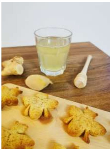
Slika 5: Ambrožev napoj in Ambroževa modrost

Osrednja sestavina naših medenih kulinarčnih spominkov je, seveda, med lokalnih šmarških čebelarjev.