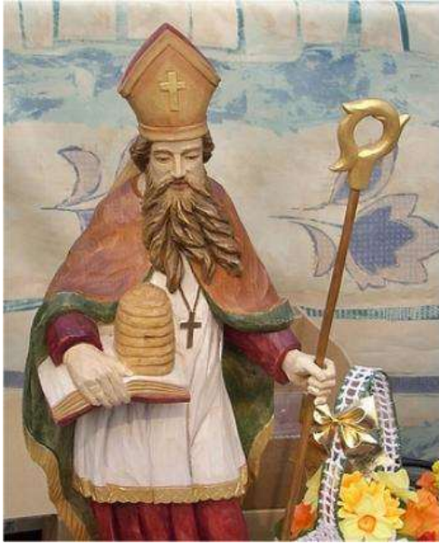
Slika 3: Kip sv. Ambroža

"...nekoč, ko je bil Ambrož še dojenček, je roj čebel na njegovem spečem obrazku in v ustih pustil sled medu. Njegov oče je to razumel kot znamenje, podelil mu je ime in verjel, da bo sin odrasel v moža z "medenim jezikom", to je, da bo imel velik dar za govorništvo, kar se je tudi uresničilo." Vir: https://mro.si/11280 6. 1. 2024 (Muzeji radovljiške občine)