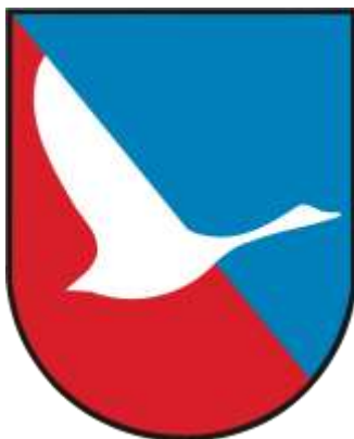
Slika 6: Grb občine Šmartno ob Paki

Turistični izdelek za tržno prepoznavnost potrebuje dober logotip. Pri snovanju logotipa smo izhajali iz grba občine Šmartno ob Paki. Ozadje grba je modro in rdeče. Modra barva predstavlja reko Pako, rdeča pa barvo plašča, ki ga je sveti Martin dal beraču. V osrednjem delu grba je gos.