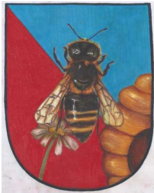
Slika 7: Logotip Ambroževih medenih sanj

Za naš logotip smo ohranili obliko in rdeče-modro ozadje grba, saj smo del lokalnega okolja. Gos smo nadomestili s čebelo, ker ta predstavlja naš turistični projekt. Čebeli smo dodali satje, ki ponazarja koncept sob za izvajanje apiterapije . Motiv cvetlice je prav tako povezan z omenjenimi sobami in prebujanjem čutil. Cvetlice lahko vonjamo, jih tipamo in občudujemo njihovo raznobarvno lepoto.